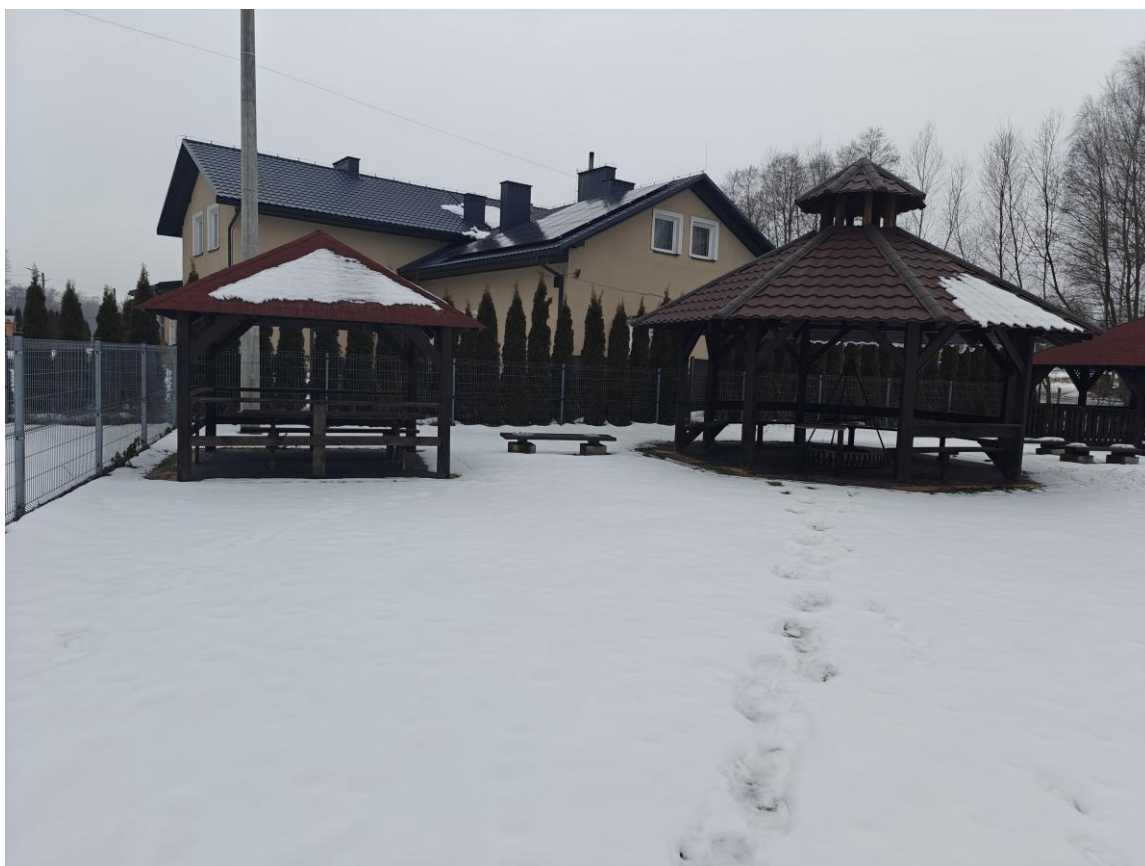
Drewniane wiaty na placu rekreacyjno-sportowym przy stadionie