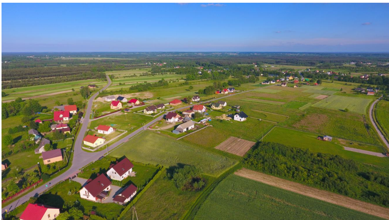
Walory krajobrazowe wsi Trzęsówka