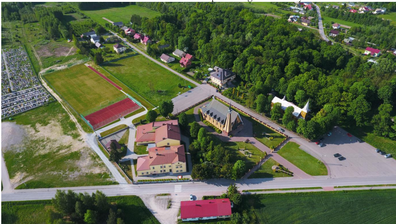
Kompleks szkolny z infrastrukturą sportową oraz Kościół pw. Św. Anny