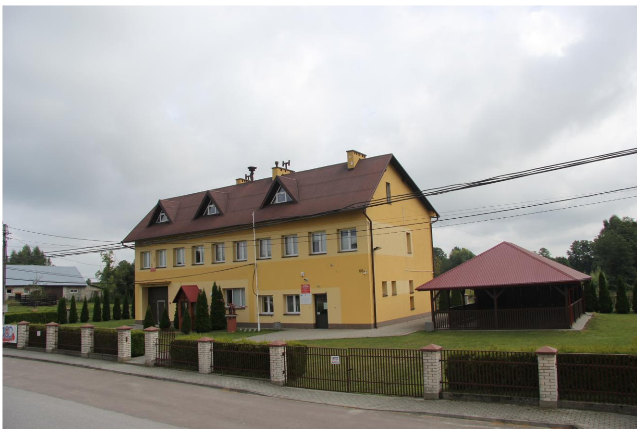
Wiejski Dom Kultury, OSP oraz drewniana wiata