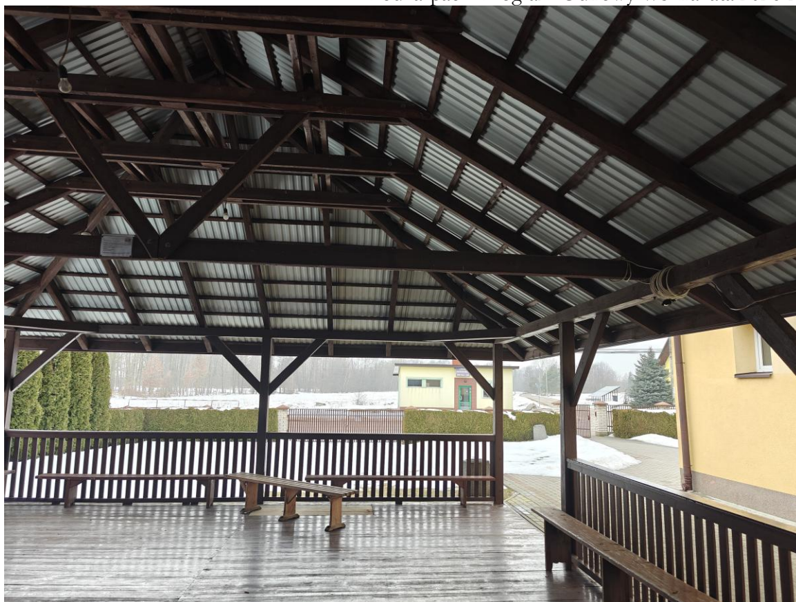
Drewniana wiata przy Wiejskim Domu Kultury