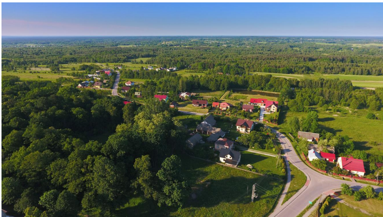
Walory krajobrazowe wsi Trzęsówka