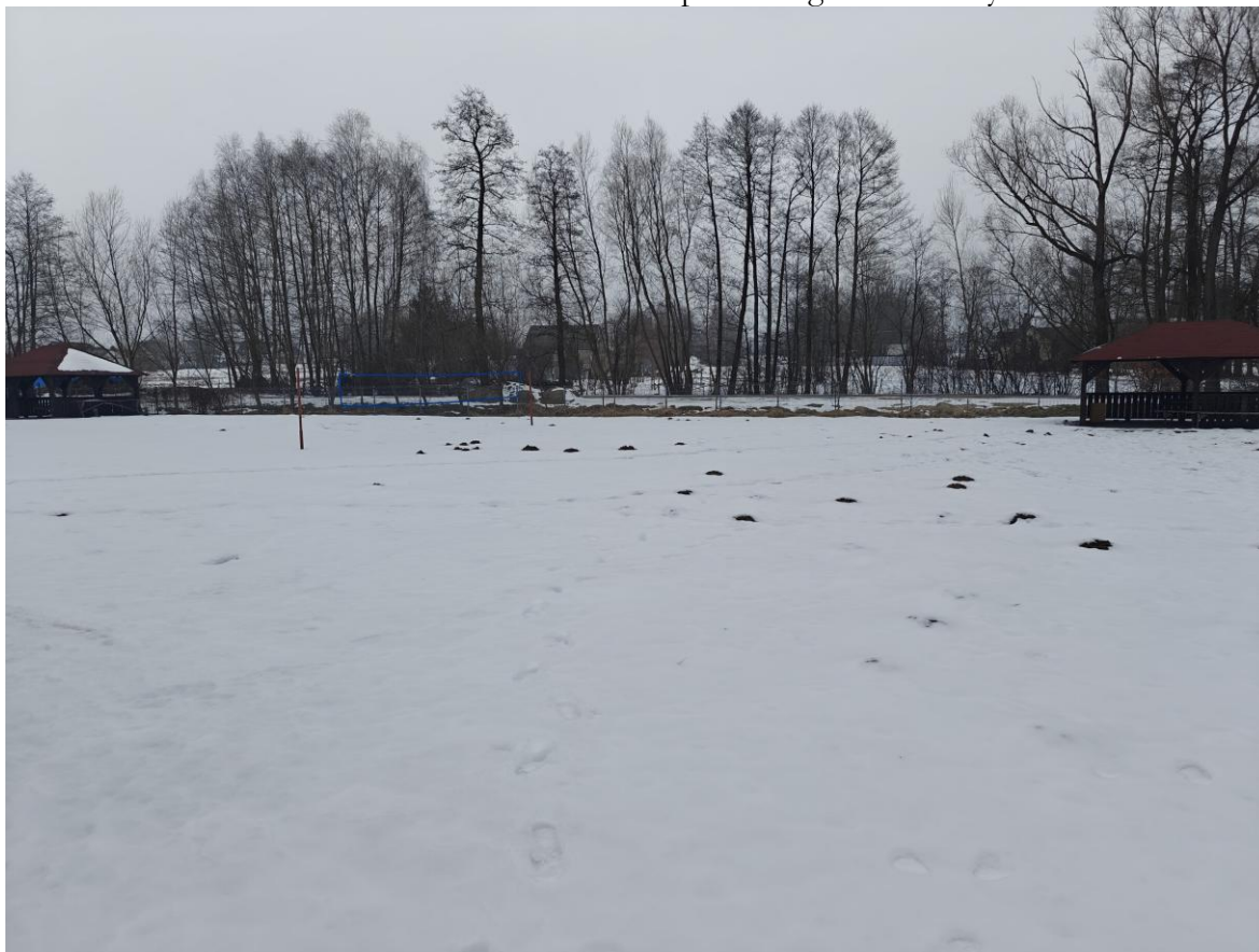
Plac rekreacyjno-sportowy przy stadionie