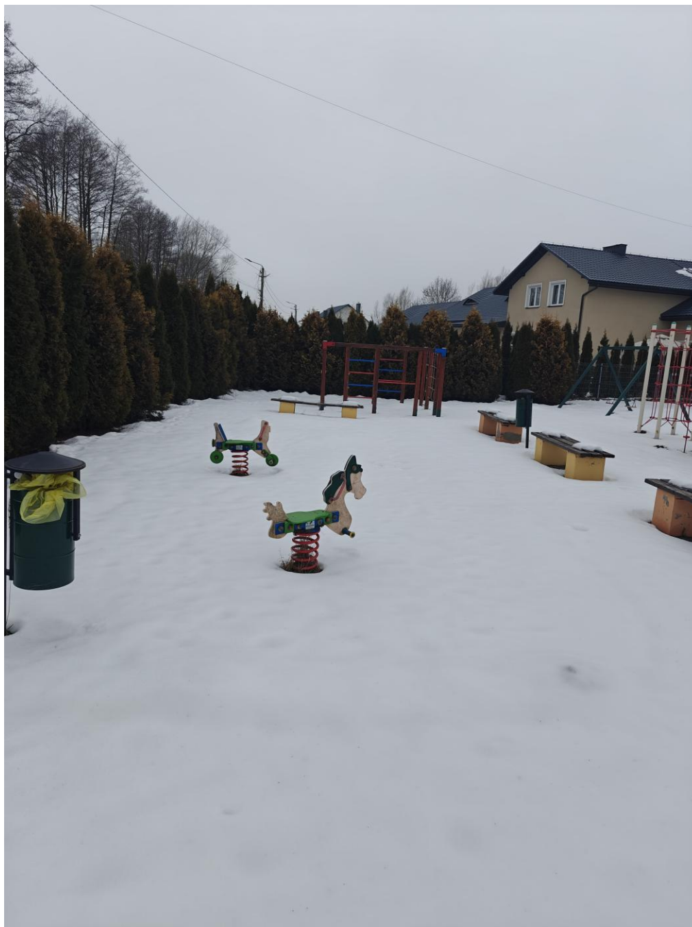
Plac zabaw na placu rekreacyjno-sportowym przy stadionie